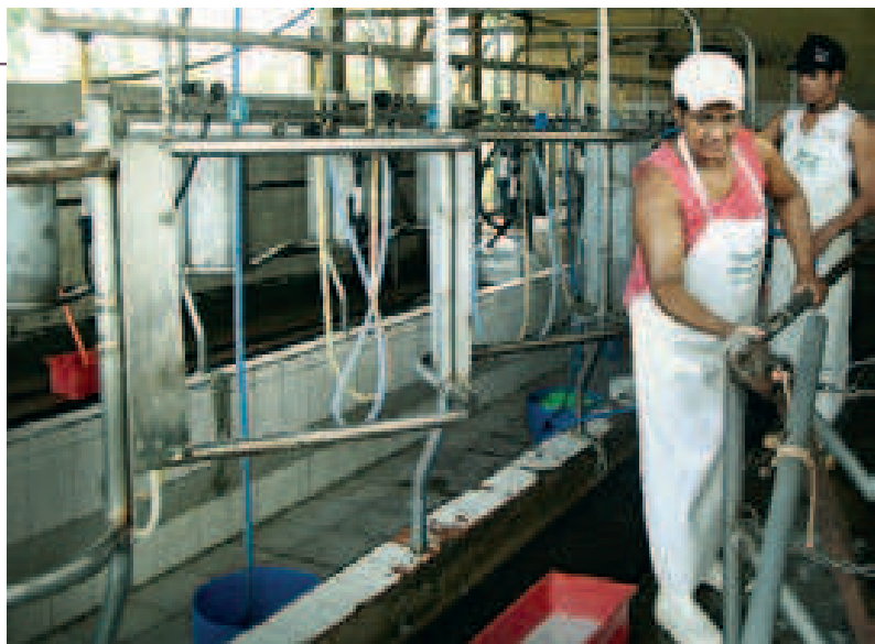
▲ La laiterie est l'une des deux activités essentielles de la Copavi.

Tous les matins et tous les midis, les habitants-travailleurs prennent leur repas ensemble au réfectoire. Le soir, en revanche, la viande, le feijão (un plat de lentilles) et le riz sont mangés à la maison, en famille. Chacun prend ou reprend ensuite sa place au sein de l'organisation parfaitement